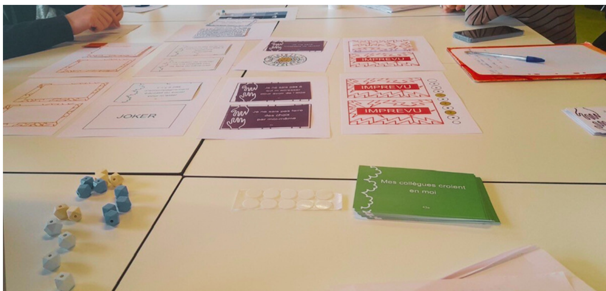
Photo de l'installation du jeu

Je suis habitante dans le quartier Humanicité et ce quartier me semblerait être le bon endroit pour tester le jeu.