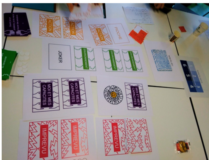
Photo de l'installation du jeu

Ce jeu n'a pas encore de nom, la rédaction attend avec impatience vos idées.